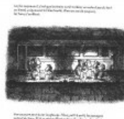
Au bord des voies

catastrophique, sa politique incroyable, ses relations difficiles avec sa voisine du Sud ainsi qu'avec toute l'Asie du Sud-Est. En faisant ainsi le choix de distinguer ainsi brutalement les scènes simplement rapportées, appartenant à l'expérience directe d'un homme, des encarts didactiques, Monsieur Oh met encore plus clairement en relief la qualité immense de son livre : la nudité brute de son témoignage est aussi peu organisée que possible. Elle possède la séduction simple du récit de voyage, l'honnêteté sans calcul du compte-rendu : c'est son dépaysement que Monsieur Oh partage, et sans jamais en tirer de leçon morale il laisse ce dépaysement traduire peu à peu le mélange paradoxal de distance et de proximité qui fait le fond de son malaise. Vivement le second tome.