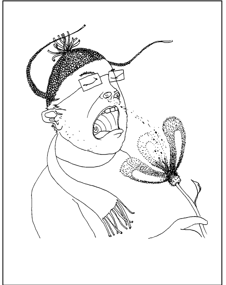
4 pages extraites de Influenza